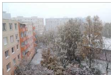
Dunaújvárosban már havazott